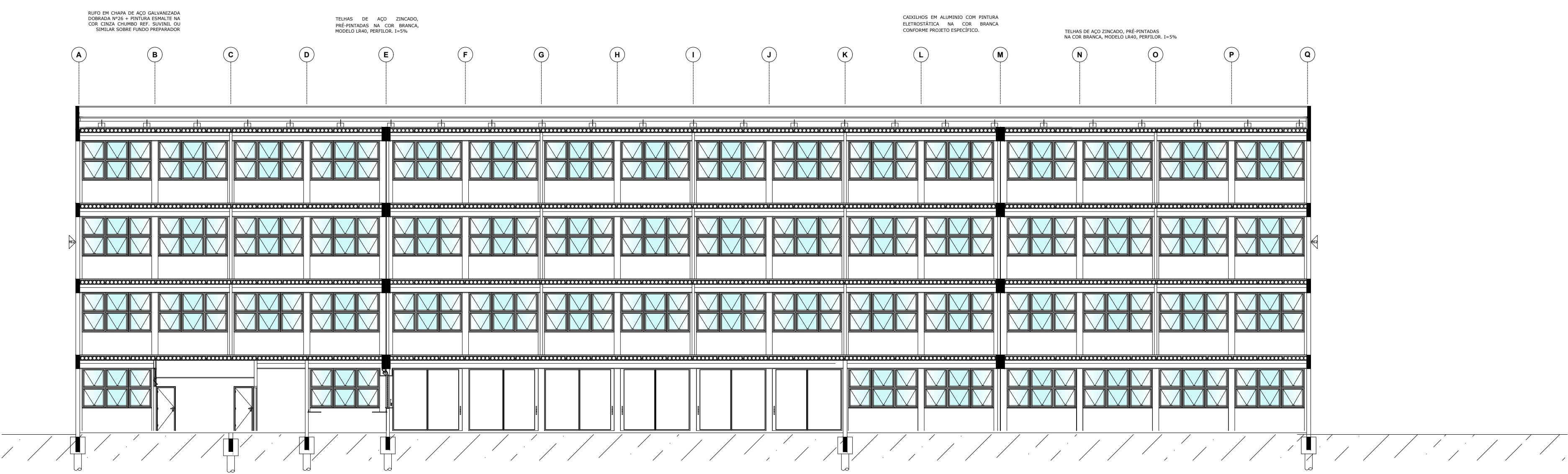
BLOCO TAU - CORTE C-C VISÃO FUNDO